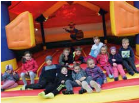
Die Hüpfburg war das Highlight für die Kleinsten