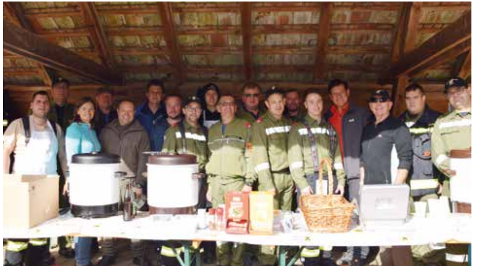
Das Team der Freiwilligen Feuerwehr Marz bewirtete die vielen Gäste