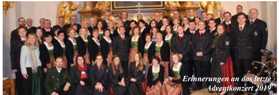
Erinnerungen an das letzte Adventkonzert 2019

Die Gestaltung einer jährlichen Gedenkmesse soll auch zukünftig beibehalten werden, die Verabschiedung mit letzten Grußworten und Sängerbahn ist bei Begräbnissen weiterhin vorgesehen. Die Angehörigen der verstorbenen Mitglieder werden rechtzeitig über den Termin des Gedenkgottesdienstes verständigt.