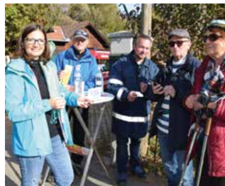
Selbstverständlich wurde auch die 3-G Regel kontrolliert