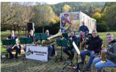
Zünftige Blasmusik gab es von den Eselblech-Musikanten