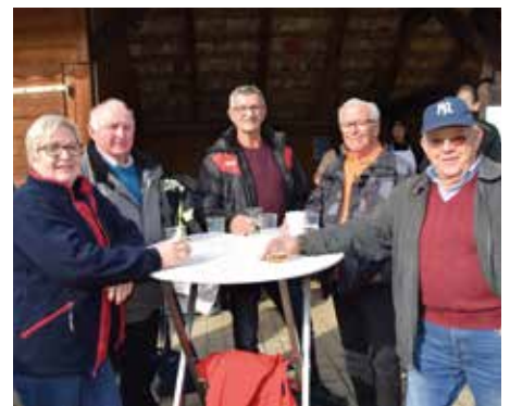
Die vielen Gäste freuten sich über das gemütliche Beisammensein