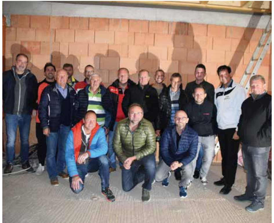
Das Helferteam mit Bürgermeister und Vizebürgermeister bei der Gleichfeier