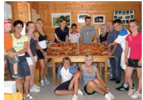
Alle Hände voll zu tun hatten das Betreuer-Team und alle, die die Kinder gepflegten, denn Sport macht hungrig!

Eltern, Großeltern und anderen Zuschauern vorführen konnte. Anschließend wurden die Kinder bei einer Siegerehrung geehrt, die in eine lustige Grillfeier überging. Ein herzliches Dankeschön an alle unterstützenden Personen und Sponsoren.